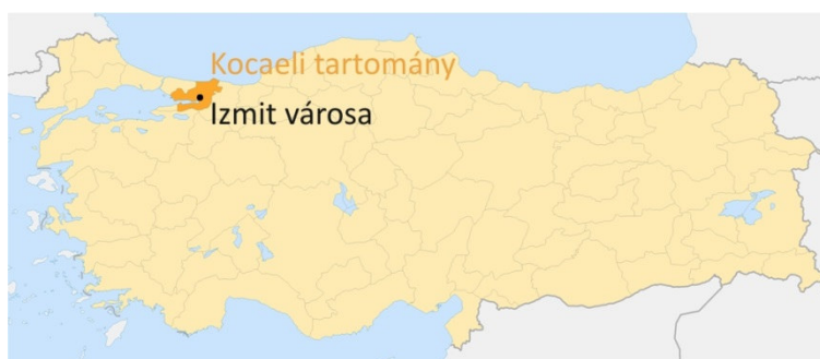
1. kép. Kocaeli tartomány és İzmit városa.

Az egykori Nikomédia, mai nevén İzmit, Kocaeli tartomány (1. kép) iparosodott székvárosa számos történelmi és természeti csapás következtében igencsak híján van feltárt és látogatható kulturális örökségnek. Azonban tény, hogy a történelem során mindvégig stratégiai fontosságú település volt, mely az Európa és Ázsia közti legrövidebb szárazföldi útvonalon elfoglalt helyének köszönhető. Ez jelenti a Balkánról érkező és Keletre tartó szárazföldi útvonalakat, de jelenti a tengeri tranzitállomás szerepét is, ugyanis a Márvány-tengerre, ezáltal az egész Mediterráneumra nyitott, azonban öböl végpontként védett tengeri kikötővel rendelkezik. Ezen kívül közel fekszik a Fekete-tengerhez, és a Boszporuszhoz, ezáltal Bizánc / Konstantinápoly / Isztambul városához is, melynek fontossága egyértelmű. Így nem csoda, hogy a legkorábbi térképeken (2. kép) is jelölt település a térséget uraló szinte valamennyi hatalom (Bithynia, hellének, rómaiak, Bizánc, szeldzsukok, oszmánok és törökök) terjeszkedésében kulcsszerepet játszott.