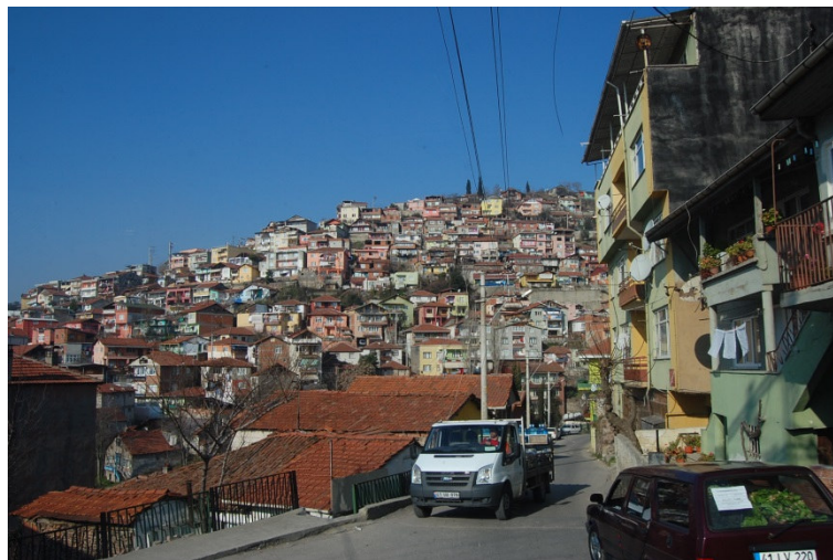
7. kép. İzmit egy mahalléja ma. Fotó: Kovács Máté Gergő, 2010

Leginkább azonban az nehezíti a feltárást, hogy a mai İzmit központja pontosan az antik város fölött fekszik, sűrűn beépítve (7. kép).