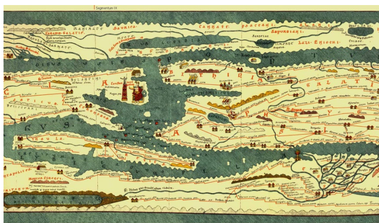
2. kép. Tabula Peutingeriana. Forrás: Bécsi Nemzeti Könyvtár (1)

A természeti forrásokban gazdag területen 1950 és 1980 közt M. Özdoğan vezetésével a fekete tenger-parti Kefken-Sarısu körzetben paleolitikus telepeket tártak föl, mely bizonyítja, hogy a terület már a történelem korai szakaszában is lakott volt. Egyes kutatók úgy vélik, hogy a közép-anatóliai Hettita Birodalom ebben az irányban is terjeszkedett (Kaska törzs), azonban az első bizonyított és írott forrásokkal rendelkező népcsoport azok a trák törzsek voltak, akik a Balkánon történő kora-vaskori népvándorlások következtében Anatóliába jöttek, és a frigeekkel és bithyniaiakkal virágzó településeket hoztak létre (2). Bithynia a pontusi Sztrabón leírásai alapján egy dimbes-