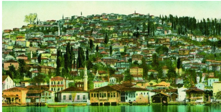
3. kép. İzmit látképe a századfordulón.

A birodalom összeomlásának idején és az 1923-ben születő köztársaság korában az elsőként kialakított tartomány (törökül il), Koceli székhelye. Kocaeli tartomány Isztambul keleti szomszédja, északon a Fekete-tenger, délen pedig a Márvány-tengerből nyíló hosszú İzmit öböl mossa partjait. İzmit neve nemcsak azért adhat okot számos félreértésnek, mert a korábban említett Iznik és İzmirrel könnyen összetéveszthető, hanem azért is, mert a székhely neve, vagyis İzmit helyett gyakran használják a tartomány, vagyis Kocaeli nevét, de korábban a város viselte az İznikumid, İznikmid és Izmid neveket is. (3. kép) Magyar vonatkozása is van İzmitnek, mely Székesfehérvár testvérvárosa, ugyanis itt élt élete végén 1701-1705 közt száműzetésben Thököly Imre. Halálának 300. évfordulóján utcát neveztek el róla, majd 2008-ban megnyílt a Thököly Emlékház, mely érdekes módon a török köztudatnak is szerves része. Jelentős ipari központ: elsősorban olajfinomítója, vegyipara, papírgyára híres, de a környékbeli körzetek (Gebze, Gölcük, Karamürsel, Derince, Kandira) közigazgatási és kereskedelmi központja.