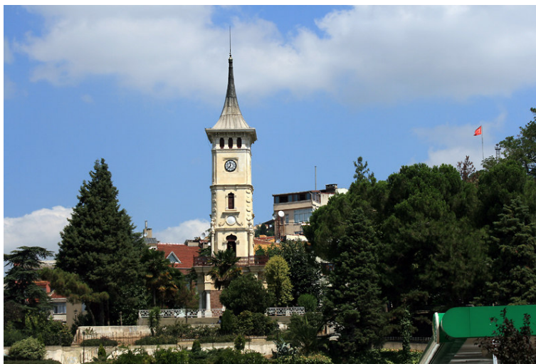
5. kép. İzmit Saat Kulesi.

Természetesen építészettörténeti szempontból számos jelentős emlék ma is felkereshető, ám két kivétellel ezek többsége a késő-oszmán és a kora-köztársaság, vagyis az első világháború és az azt követő két évtizedben épült. A két kivétel a neves oszmánli építész, Szinán mesternek tulajdonított apró, egykúpolás dzsámi, az egyik a Pertev Paşa Câmii (4. kép), a másik pedig a Mehmed Bey Câmii, mely a város központját a tengerparttól elválasztó Isztambul-Ankara autótút szomszédságában, az autótút fölött terpeszkedő impozáns, ám sokak által vitatott gyaloghidak lábánál fekszik, kertje azonban számos teaházával a helyiek népszerű találkozóhelye.