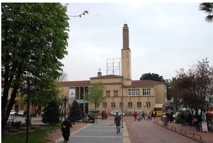
6. kép. Seyfi Arkan: İzmit Halkevi. 2010

Atatürk kedvenc építészeként tartották számon (24). Az İzmiti népháznak célja, az atatürki reformok megismertetése és végrehajtása a néppel, vagyis írás-olvasás órák, idegen nyelv és művészeti tanfolyamok, színházi előadások során a nép felvilágosítása és a köztársasági eszme terjesztése volt (25). Építése az alapító törvény 11. évfordulóján, 1943-ban végződött, és a kormányon kívül bankok, és iparosok is támogatták (26). Az elkészült épület alapvetően modern volt – a funkciót kiszolgáló, szigorú, egyszerű tömegek áthatásából létrejövő épület – a tudás gyára. Vasbeton falak, hatalmas ablakok. Mégis rendelkezik olyan stílusjegyekkel, mely a nép által népszerűvé és befogadhatóvá, felismerhetővé tette: hangsúlyos kémény, kapu, udvart körülölelő kubus. Túlhangsúlyozott kéménye jelzi a népház helyét, akár a történeti városközpontot és fórumot jelölő mecsetek és dzsámik minaretjei, nagyvonalú kapuzata pedig egyszerre fejezi ki diadalívként a dicsőséges köztársasági eszméket, és hívogat tovább az épület által körülölelt belső kertbe. A népház célja az oktatás, a köztársaság szellemében való nevelés és a közösségépítés, így a korábbi iszlám iskolákhoz, vagyis medreszékhez hasonlóan belső udvart keretez az épület, melynek tömegformálása a tengerparti pavilonok, vagyis a klasszikus köskök hangulatát adja. Azonban arányai, léptéke, elhelyezése mind-mind emberi. Nem akar lenyűgözni, csupán otthont ad a közösségnek.