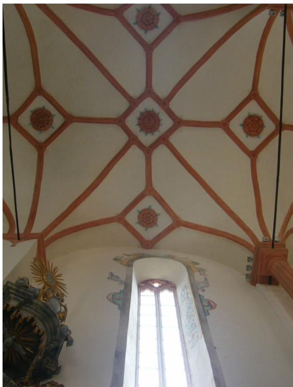
3. kép. Árva vára/Oravsky Podzamok, kápolna boltozata (1611).

A középkori templomforma hagyománya jelenik meg az eperjesi evangélikus templomon. Az eperjesi magyar evangélikusok által felépített, diadalívvel és jelentősen szűkülő poligonális szentéllyel 1642-47 között épített emlék csehboltozatos belső terével, fiókos félgömbkúpulájával, klasszikus tagozatrendű belső architektúrájával és manierista nyíláskereteivel már a késő reneszánsz illetve a kora barokk építészetéhez kapcsolható. Belső terét három oldalról patkó-szerűen körbefogó karzata a protestáns templomépítészet újkori problémáira, a gyülekezetnek mint a „szentek közösségének” elhelyezésére és a karzat méltó építészeti formálására összpontosít. Az eperjesi templom helyét a legújabb szlovák építészettörténeti összefoglalások is a késő reneszánsz templomépítészet keretében tárgyalják (10).