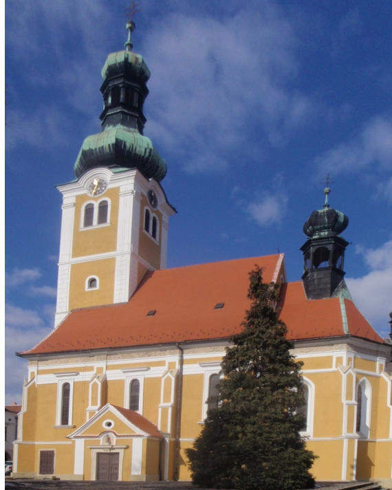
2. kép. Kőszeg, Szent Imre templom (1615-18).

szám alatti lakóházban tartották miséiket. Ha ismerhetnénk ennek az épületnek a működését, ez a városi protestáns imaház típusának lehetne érdekes viszonyítási párhuzama, ennek építészeti értelmezéséhez azonban nincs további adatunk.