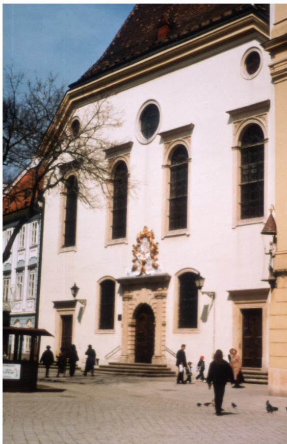
5. kép. Pozsony, első német evangélikus templom (1637).

A 17. század első felének – egyúttal az ellenreformáció kezdetének – kiemelkedő emléke a pozsonyi első német evangélikus templom, amely 1637-ben épült fel, és 1672-ben a jezsuitáké lett (14). (5. kép) Ez az épület a Királyi Magyarország legfontosabb késő reneszánsz evangélikus temploma, a lutheránus városi polgárság reprezentatív középületként épült a fővárosban. Az épület építészeti igényes formálása ellen Pázmány Péter és Pálffy Pál kamaraelnök is szót emelt. Esterházy Miklós nádor végül csak torony és félköríves szentélyzáródás nélkül, szerényebb nyílásarchitektúrával és kevésbé díszes kapuval engedélyezte. Látható, hogy ezek a korlátozások az épület külső karakterének erős korlátozásáról szóltak, és az elnevezése is kötelező jelleggel templom helyett imaház, oratórium lett (15). Hasonló térrendszerű volt az 1658-ban épült pozsonyi magyar-szlovák evangélikus templom, amely 1672-től szintén katolikus lett, és azóta az orsolyiták használják. Szenice/Senica evangélikus temploma 1631-ben épült, lényegében a pozsonyi első német templom háromhajós térszervezését követte (1654-től katolikus lett, majd többször átalakították) (16).